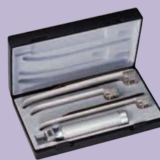
ri-standard Miller Con palas nº 2, 3 y 4.