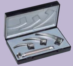
ri-standard Macintosh baby Con palas nº 0, 1 y 2.