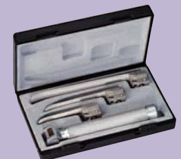
ri-standard Miller baby Con palas nº 0, 1 y 2.