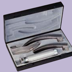
ri-standard Macintosh Con palas nº 2, 3 y 4.