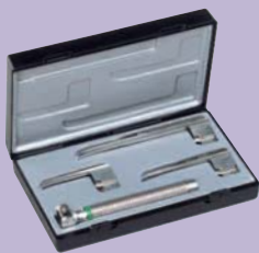
ri-modul Miller F.O. baby Con palas nº 0, 1 y 2.