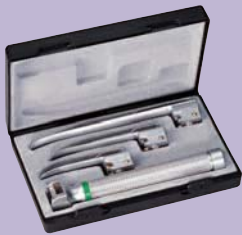
ri-integral Miller F.O. baby Con palas nº 0, 1 y 2.